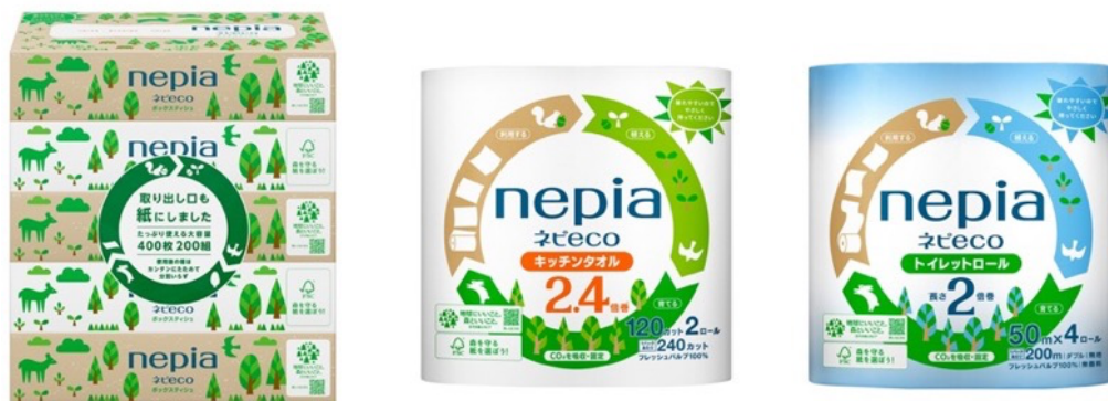
「森と地球の未来 nepia 環境月間キャンペーン」対象商品

店頭での特設売り場展開と合計 300 名に当選する大型キャンペーン実施による相乗効果で、当社の環境への取り組みを多くのお客様にお伝えすることを目指します。