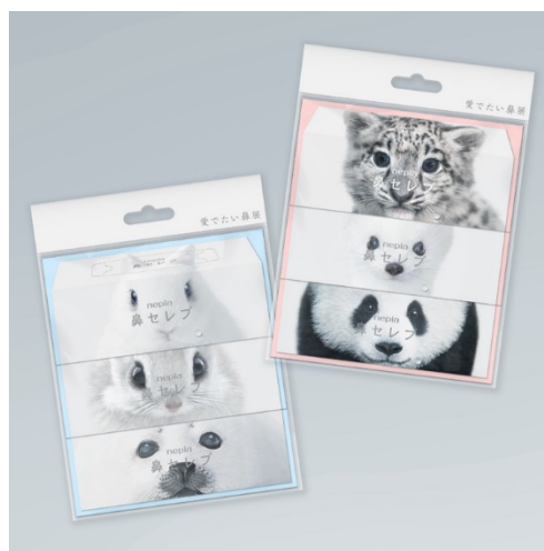
鼻セレブステッカー