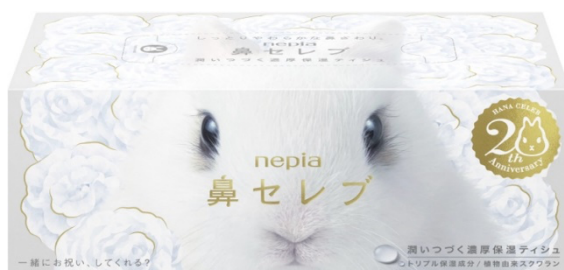
『愛でたい鼻展』限定デザインボックスティッシュ