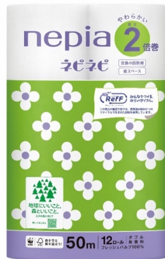
ネピネピ トイレットロール 2倍巻 12ロール RefF（リーフ） ダブル