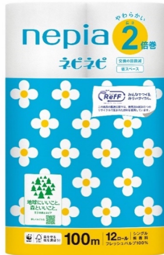
ネピネピ トイレットロール 2倍巻 12ロール RefF（リーフ） シングル