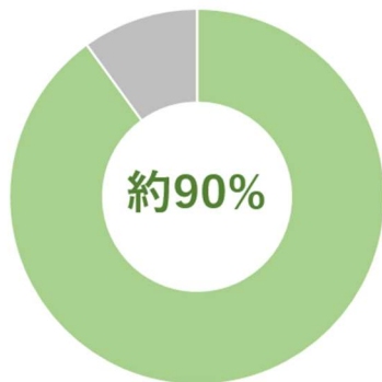
リニューアル品の購入意向

コンパクト化によりかさばらず、購入時に持ち運びやすくなりました。ストック収納時も省スペースになり、まとめ買い派にもおすすめです。1箱あたりのサイズがスリムになることで、テーブル、ベッド、洗面所、キッチンなど、狭小スペースでの使い勝手も良くなり、日々の快適性の向上が期待されます。